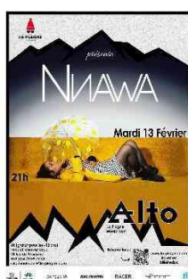
Concert Nnawa Le 13 février 2024 56 personnes / tarif 8 €