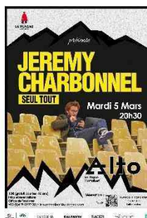
Spectacle stand up « Seul tout » Jérémy Charbonnel Le 5 mars 2024 109 personnes /Tarif 15 €