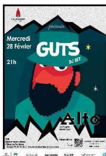
Concert DJ Guts Le 28 février 2024 382 personnes/Tarif 14 €