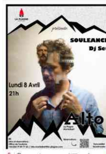
Concert Dj Souleance Le 8 avril 2024 33 personnes / Tarif 8 €