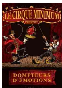
Spectacle Le cirque minimum Le 25 décembre 2023 105 personnes /tarif 5 €