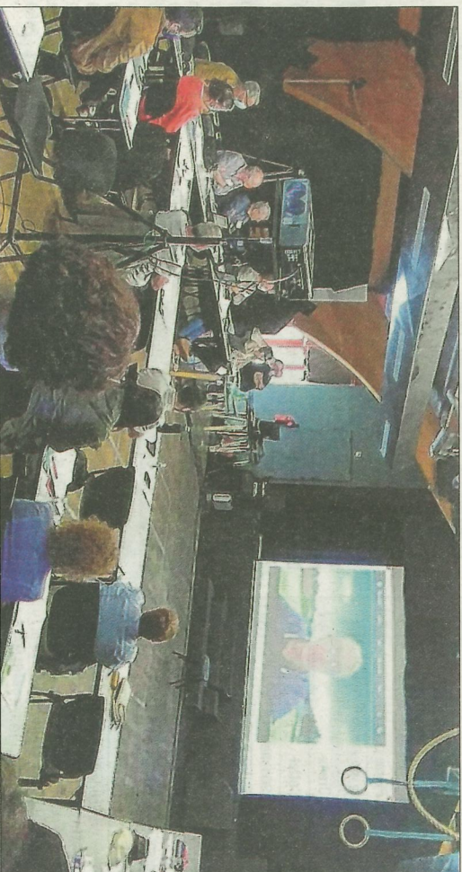
Une assemblée générale qui s'est tenue à Prapoutel (Isère).

grande équité dans le touris- me, fait de la culture et de la pratique des loisirs un moyen d'émancipation et promet en toute occasion la qualité du vivre-ensemble.