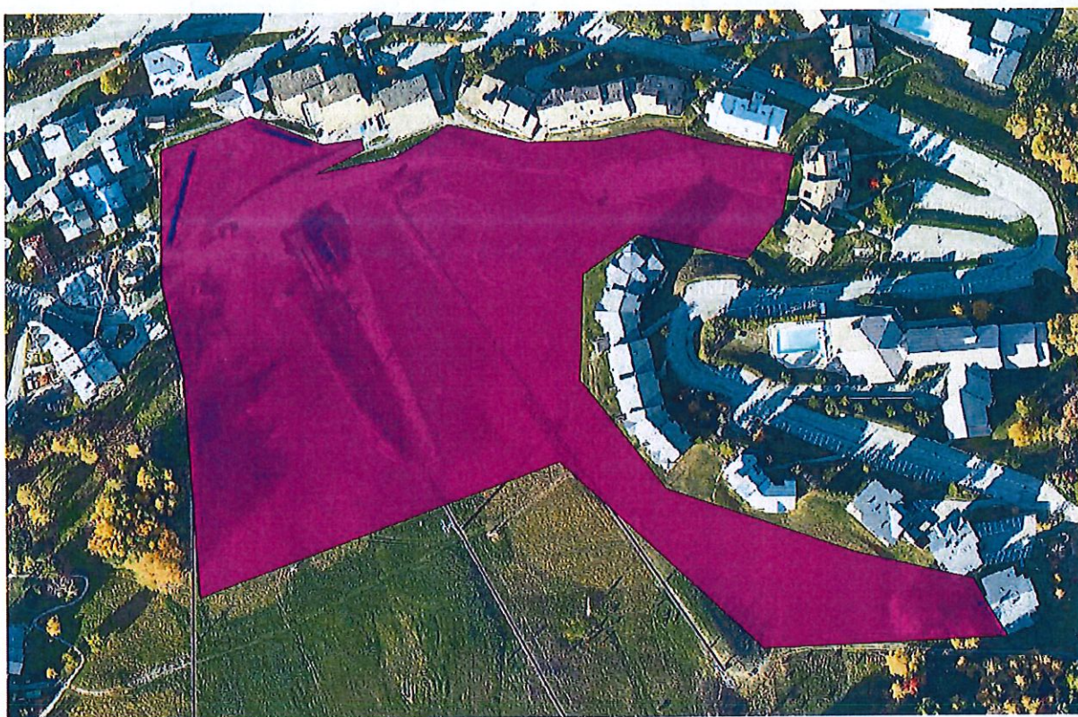
Annexe 2 zone front de neige sécurisée Montalbert