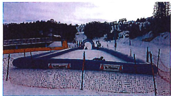
Illustration du matériel

Luge parks bleu: structure gonflable avec ventilation permanente sur minuteur (09h – 19h) Alimentation électrique : gare arrivée TS la Roche Filets type C ou B-C sur piquets polycarbonate