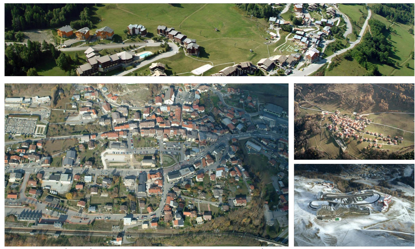
Commune historique de la commune nouvelle d'Aime la Plagne