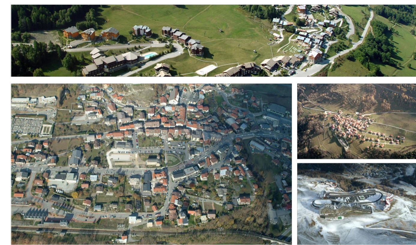
Commune historique de la commune nouvelle d'Aime la Plagne