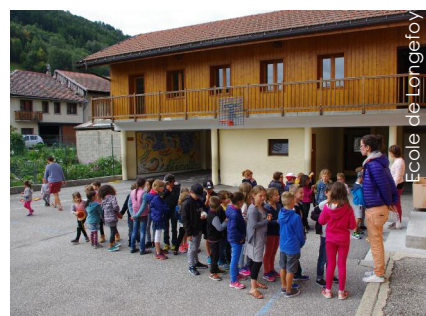
Ecole de Longefoy