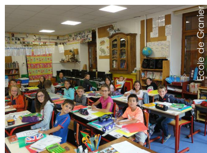
Ecole de Granier