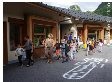
Ecole de Centron