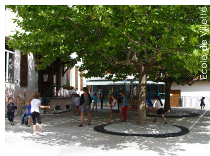
Ecole de Villette