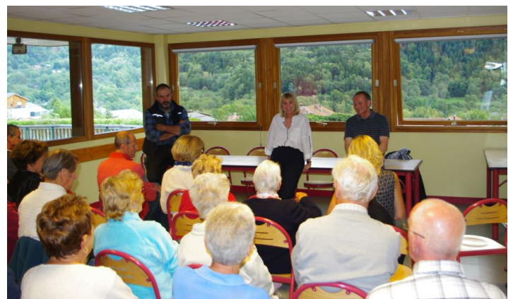
1 ère réunion du quartier des Chaudannes, Prince et Replat, le 11 septembre dernier, avec une trentaine de participants.