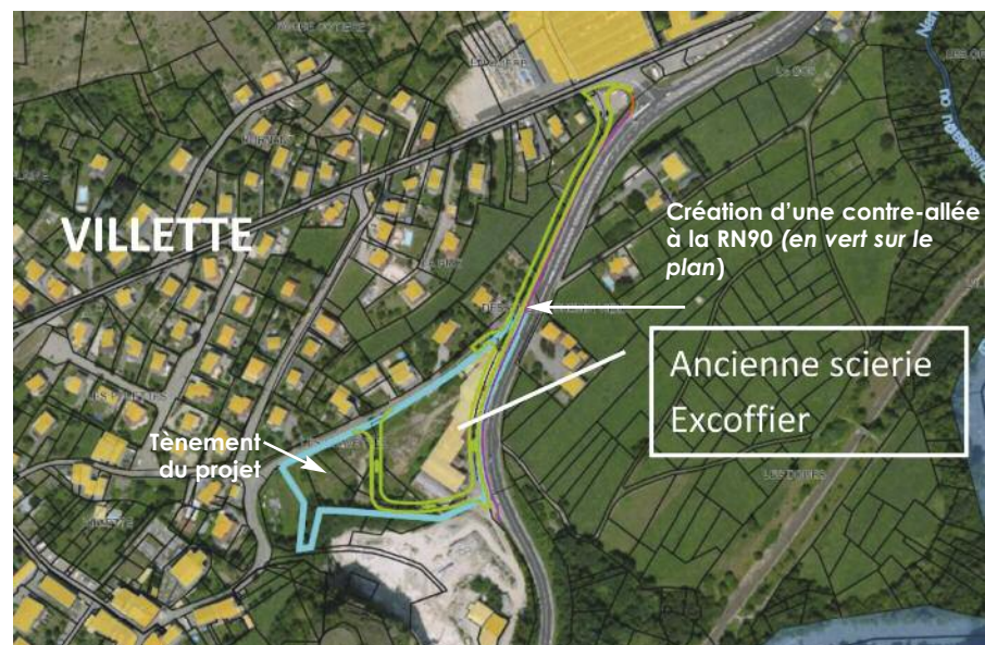
Esquisse du plan d'aménagement de la zone d'activités de Vilette.