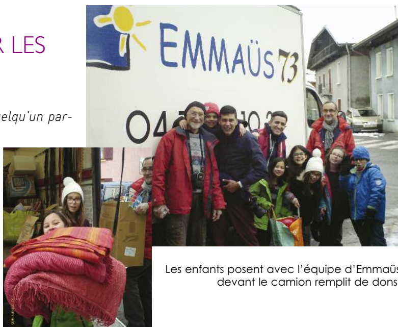
Les enfants posent avec l'équipe d'Emmaüs devant le camion rempli de dons.

Une belle preuve de solidarité !!! Merci à tous !