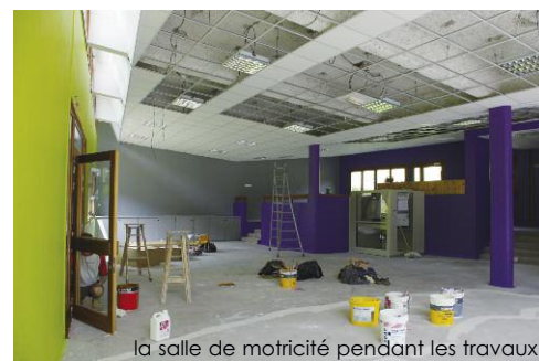
la salle de motricité pendant les travaux

. du côté des maternelles, c'est la salle de motricité qui a été entièrement réhabilitée : changement du sol, reprise des murs et peinture et installation de plafonds chauffants. Le couloir d'accès aux classes a également fait l'objet d'une reprise en peinture.