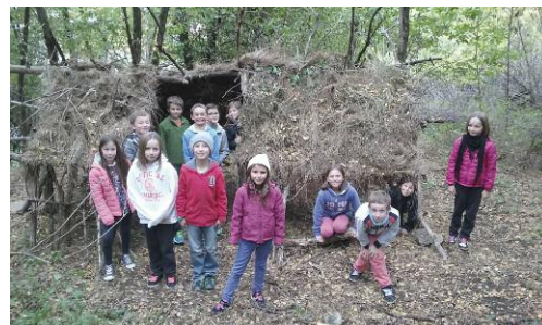
Construction d'une cabane dans les bois, automne 2015

A noter que c'est la commune qui a validé les choix des directeurs des écoles et conseils d'écoles en ce qui concerne le rythme des TAP à mettre en place.