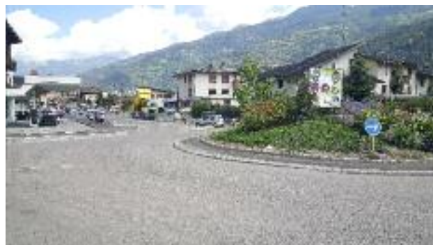
Rue de la Pige, à Granier