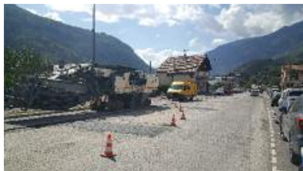
Avenue de Tarentaise

Des tables de pique-nique ont été installées à la montagne de Villette, aux lieudits La Combe et La Bagnaz.