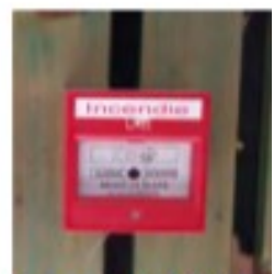
Déclencheur manuel d'alarme

Le gymnase est équipé d'une centrale incendie. L'alarme se sur un des déclencheurs manuels.