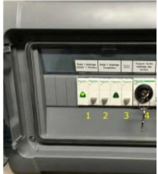
Boitier de commande d'éclairage de la halle

La mise en route de l'éclairage de la halle des sports est automatique (détection de mouvements) ; il en est de même pour l'extinction (absence de mouvements dans la salle).