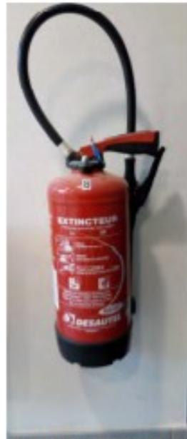
Extincteur eau 6l