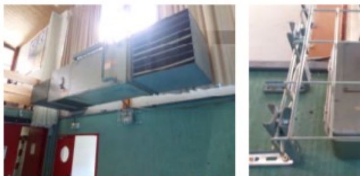
Aérotherme hall des sports... / Coffret de mise en route