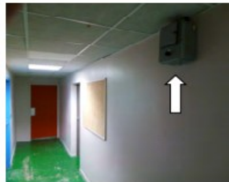
Coffret de mise en route aérotherme SALL