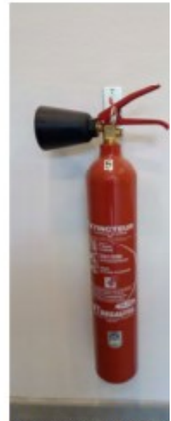
Extincteur CO2 2Kg

Robinet d'incendie armé : vous avez à votre disposition des étages vers ascenseur PMR